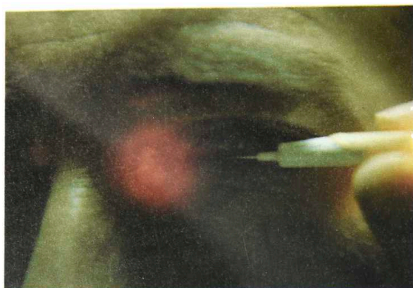
Fig 3. Transiluminación del punto lacrimal y canaliculo con la fibra óptica.